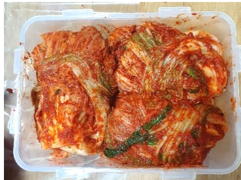
돌봄 김치 완성