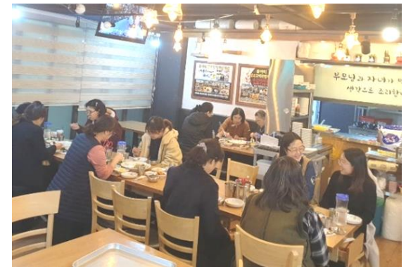
저녁 외식 짬뽕밥