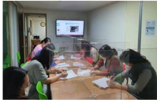
가정 관리 교육