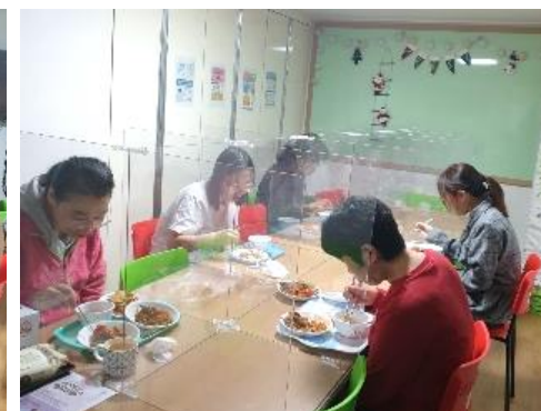
함께 먹으니 더 맛있어요 ^^*