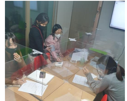
신체 관리 교육