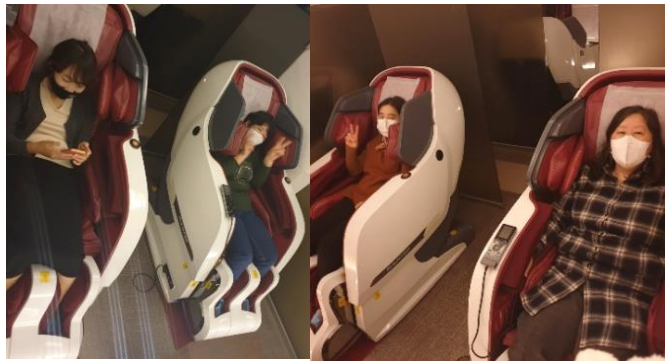
힐링 타임 (전신 마사지)