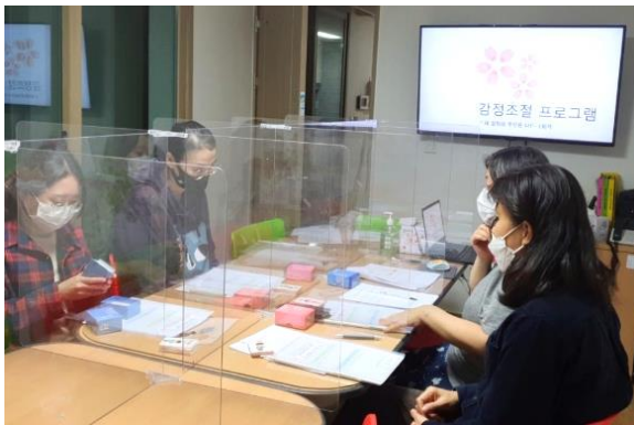
감정 관리 교육