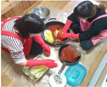
김치 속을 쑤~