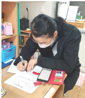
무엇을 만들어 먹을까?