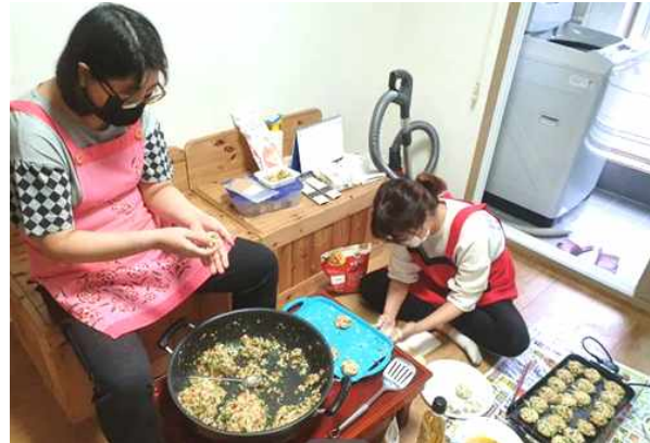
전(동태전, 동그랑땡, 꼬치) 부치기