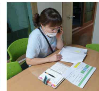
가족상담 및 기관상담