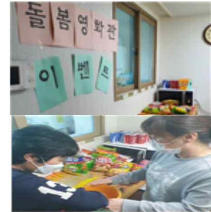
간식 추첨 이벤트