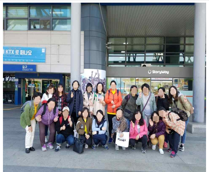
금빛열차 타고 대천 바다보러 GoGo ~