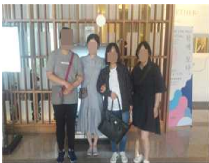
4월 여가활동 - 서촌 나들이