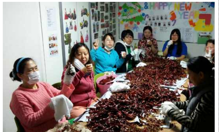
살림의 달인 '고추다듬기'