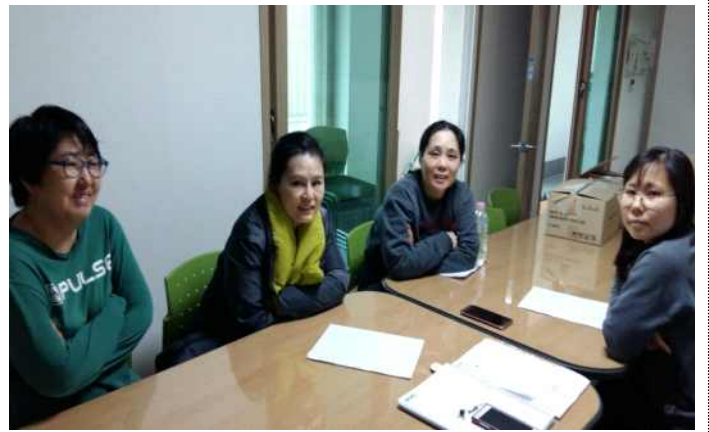
동아리활동 - 음악