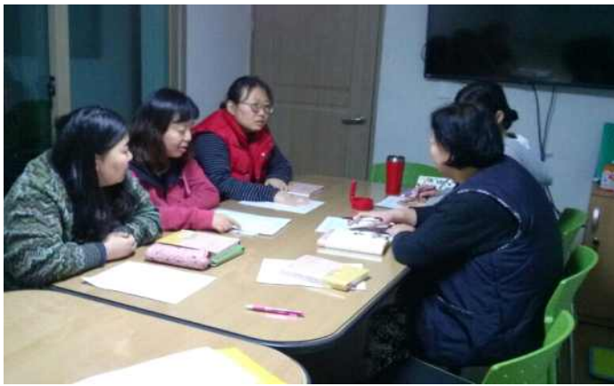
동아리활동 - 독서