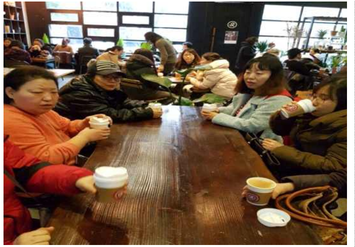
2월 4일 여가활동 : 서울 숲& 성수동 카페 거리