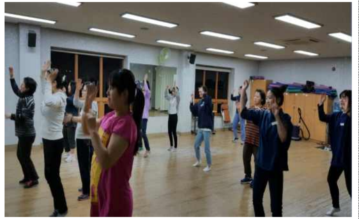
동아리활동 - 줘바댄스