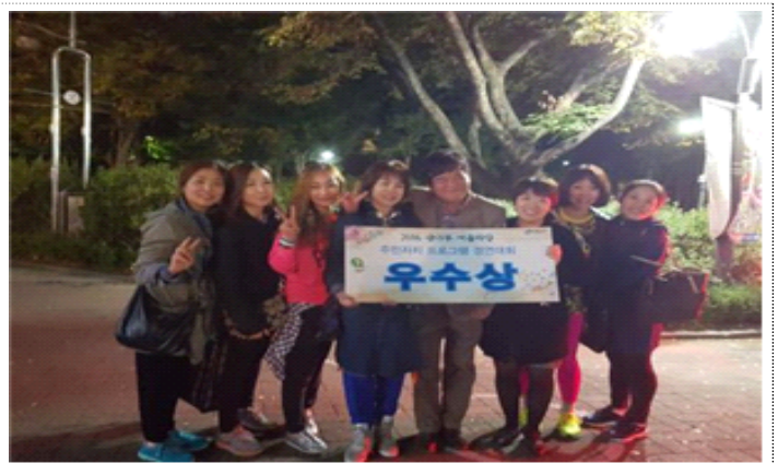
갈고 닦은 줌바댄스 실력을 한껏 뽐내고 왔습니다^^