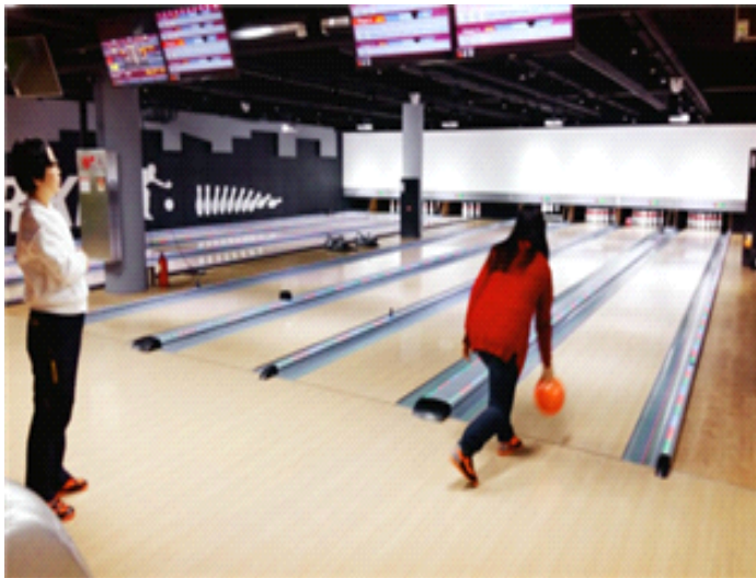
볼링공과 함께 스트레스도 안녕!