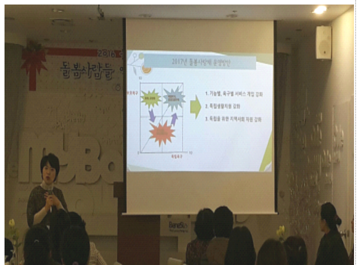
2016년 하반기 가족모임