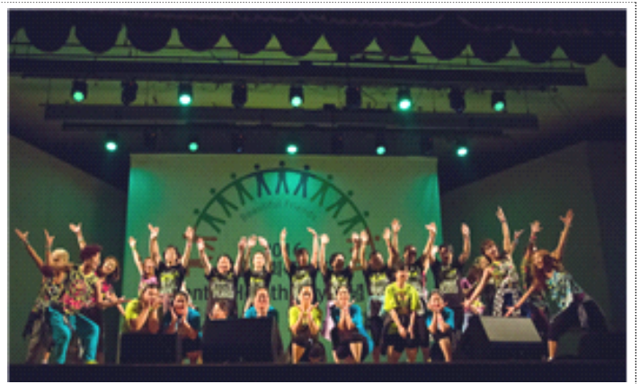
Mental Health Day 축하공연!