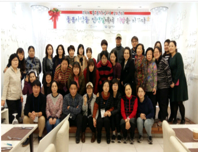
2016년 송년모임 ☺