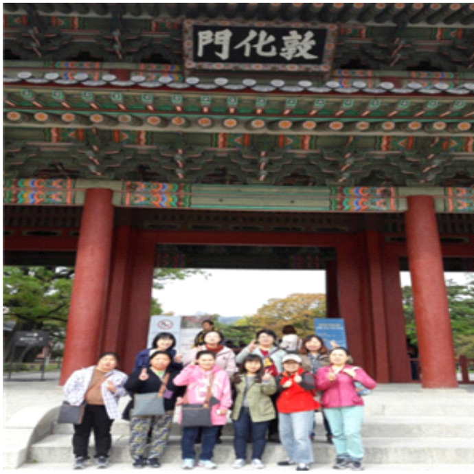
가을의 정취를 느끼며 창덕궁 앞에서..