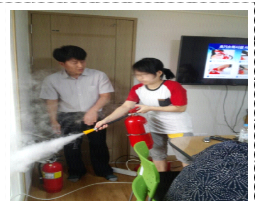
실전에서 당황하지 않을 수 있도록 소화기 체험 ◎