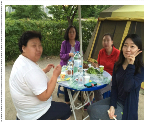
힐링캠프 맛있는 음식을 먹으며 몸도 힐링◎