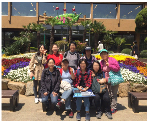
4월 어린이 대공원 나들이◎ 봄의 정취를 맘껏 느끼는 시간이었습니다