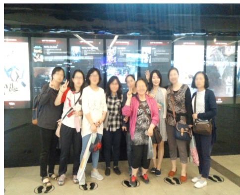
5월 영화 “스파이”관람!