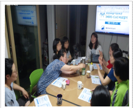
손세정제 사용으로 메르스를 이겨냅니다!