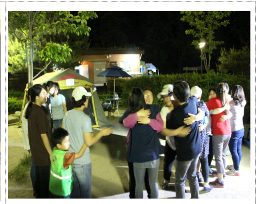
힐링캠프 릴레이 허그를 하며 마음도 힐링◎